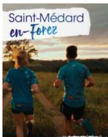
BULLEIN COMMUNAL 2024

Le conseil municipal, après en avoir délibéré, décide à l'unanimité de fixer les tarifs suivants pour l'année 2026.