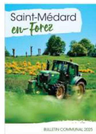
BULLEIN COMMUNAL 2025