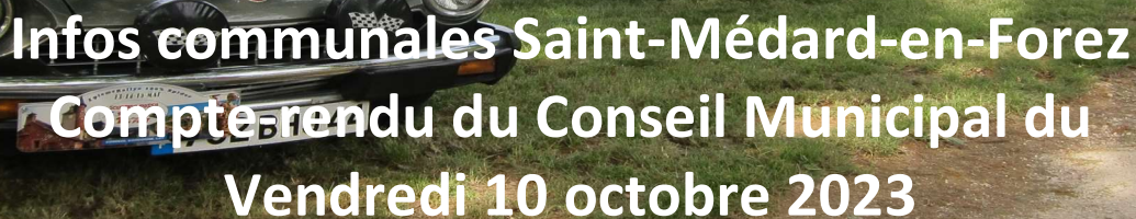
Photo d'archive : Clin d'œil aux Fiat 124 spider présentes sur Saint-Médard le dimanche 8 octobre